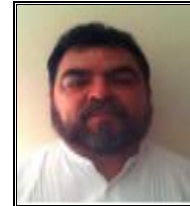
Jefe de la Oficina Operadora

La dirección de la Oficina Operadora es calle Francisco Javier Mina número 210, esquina 5 de Mayo, colonia Sonora, Soledad de Doblado, Ver., y cuenta con el sitio web http://187.174.252.244/caev/Oficinas_Operadoras/SoledaddeDoblado/ .